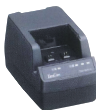
高容量 電池充電器