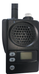
列車見張員 支援装置