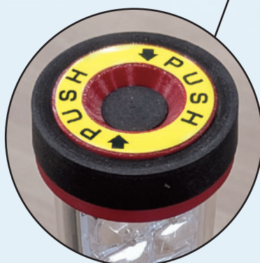
上部にスイッチを配置